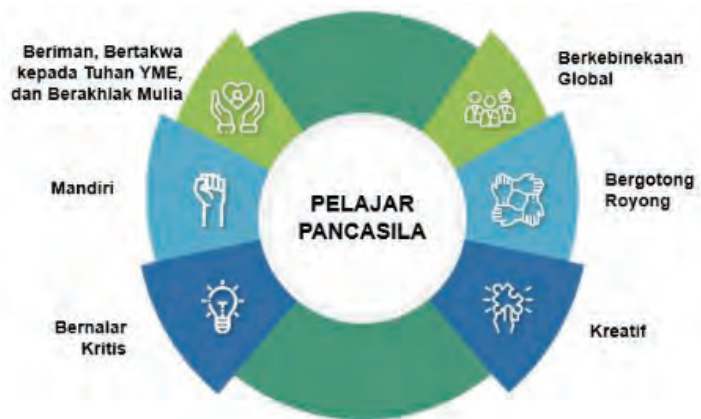
Gambar 1.1 Profil Pelajar Pancasila